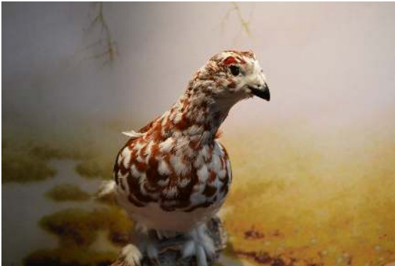
Utstoppet smølalirype, Lapogus lapogus variegatus i vinterdrakt. Det er slik Stadtwerke München insisterer på at vi må oppleve den i fremtiden. Utdødd og utstoppet. Verdens råtteste klimasak.

Stadtwerke München deltar i utryddelsen av en sårbar klimatilpasset underart av lirype. Dette er verdens dårligste klimasak, både for det offentlig eide tyske energiselskapet, og for tyske myndigheter som intervenerte ovenfor norske myndigheter like før Kommunal- og moderniseringsdepartementet (KMD) skulle fatte avgjørelsen i Frøya-saken.