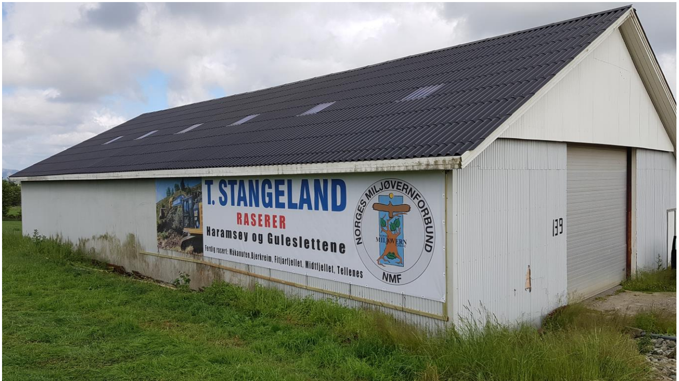
Banner 1 - driftsbygning Tjeltavegen 139, Sola kommune slik den så ut etter montering 22/6-2020.