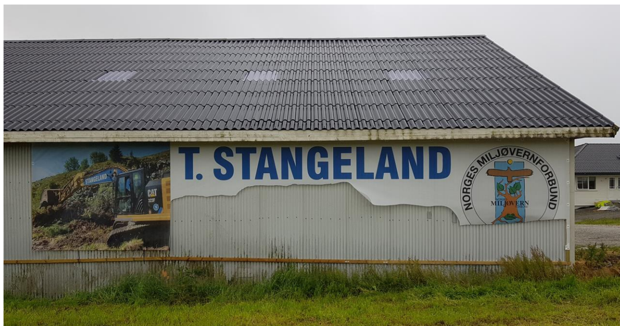
Bilder fotografert 28/7-2020