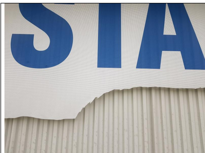
Tydelige knivmerker, kutt og riv, høyrehendt person?